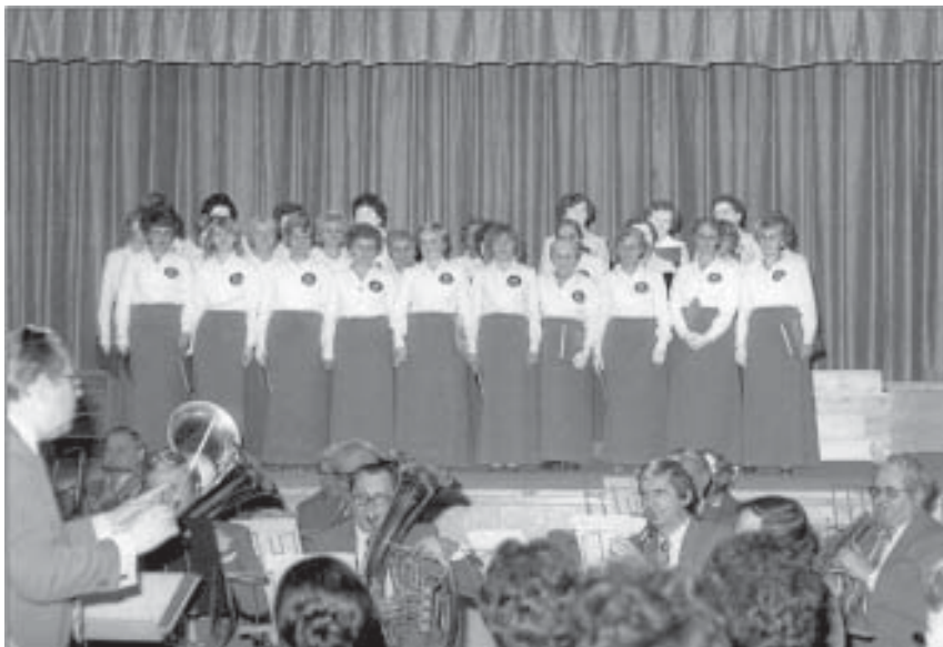
Női kar 1981.01.23.