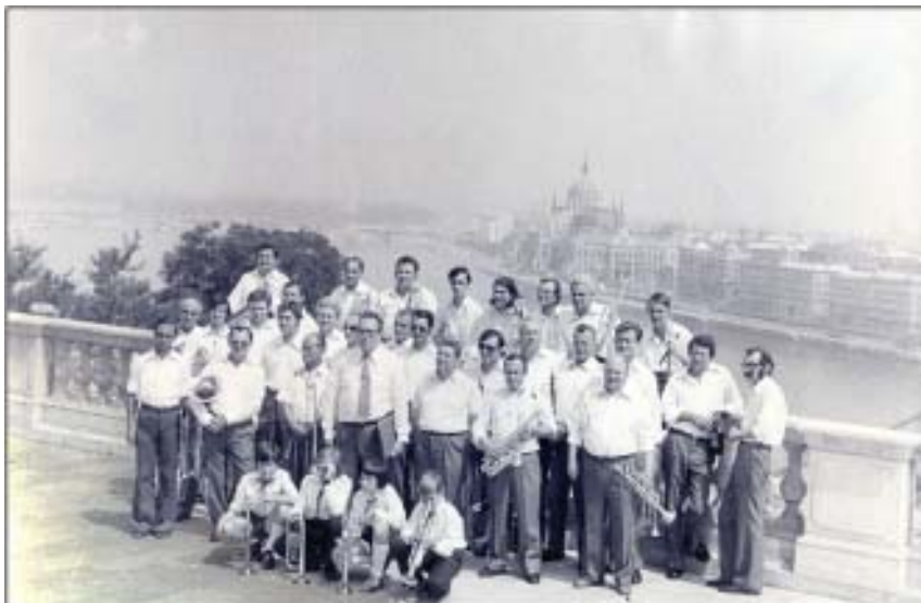
Kirándulás Budapestre, 1978.08.06.