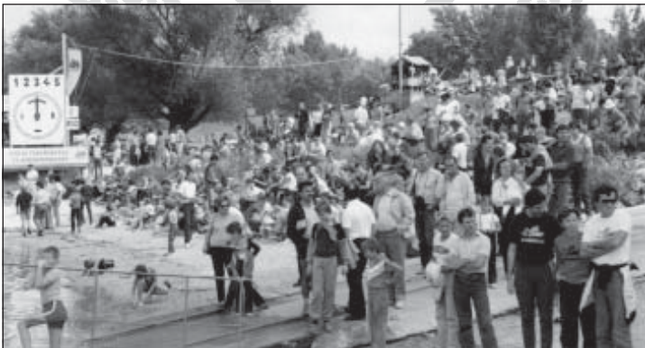
VI. Hungalu Kupa 1986-ban, a nézők a rajtra várnak

Jelenleg két egyesület működik Almásfüzitőn: az Almásfüzitői I760 Sporthajó Egyesület és az ALOXID Vizisport Egyesület. Az Önkormányzat tulajdonában lévő vizibázison várják a vizisport iránt érdeklődőket.