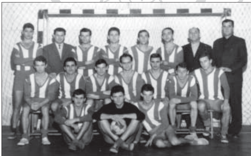
Férfi focicsapat 1966