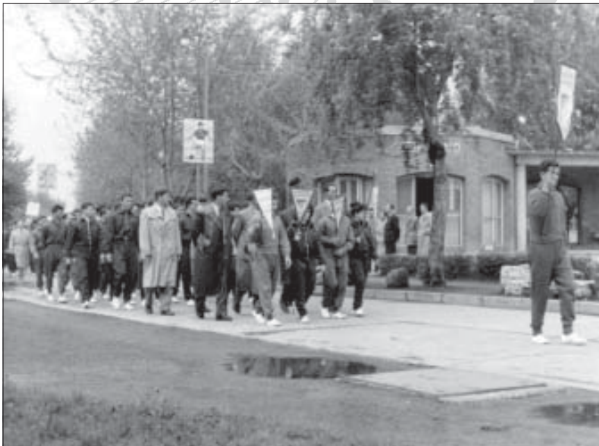
Sportolók felvonulása 1960. május 1-jén

Magamra vállaltam a névszerinti kiemelést is – elnézést kérve a sok név szerint ki nem emelt sporttársunktól és hozzátartozóitól – de talán az Almásfüzitői sportéletben játékosként, sportvezetőként, elnökként és szurkolóként eltöltött több mint 45 év feljogosít erre.