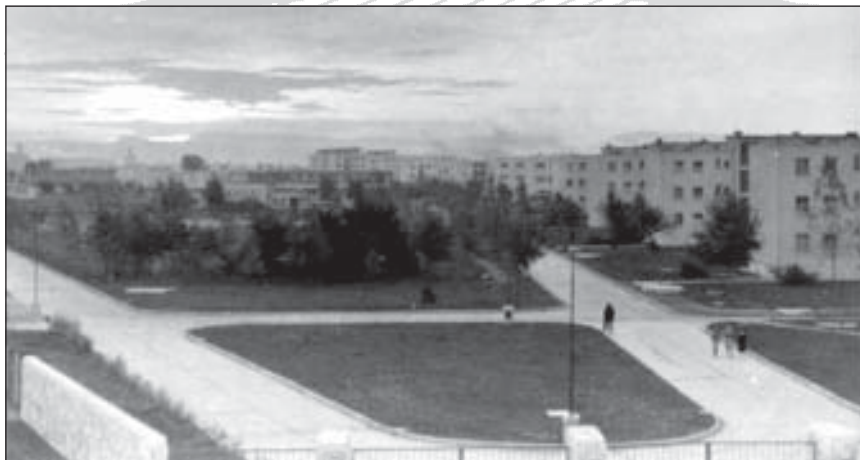
Lakótelepi látkép 1954-ből