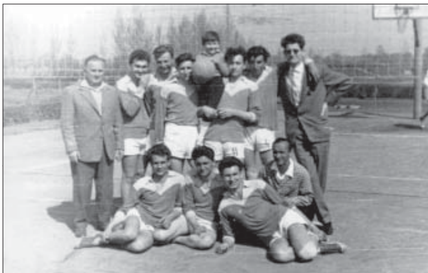
Férfi röplabda csapat