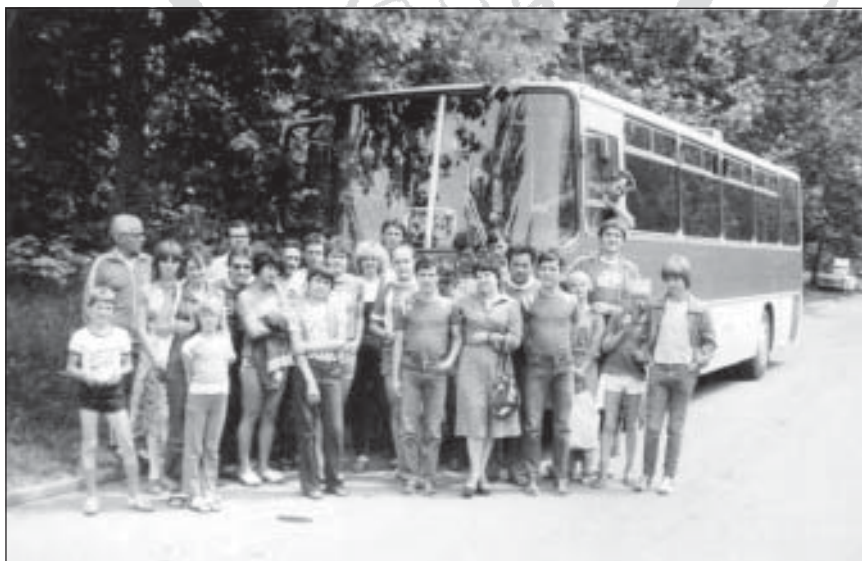
Csoportkép az egyik kirándulásról