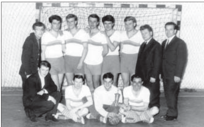
A kézilabda csapat játékosai és edzői