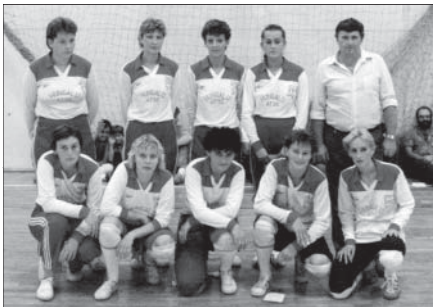
Röplabda csapat 1983