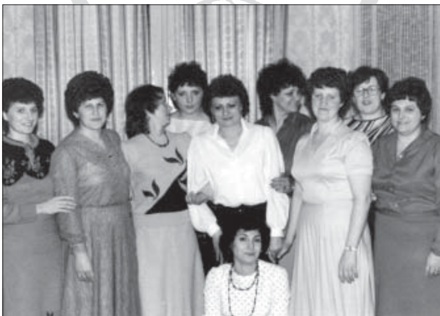
Az NB II-es kézilabda csapat néhány évvel később civilben