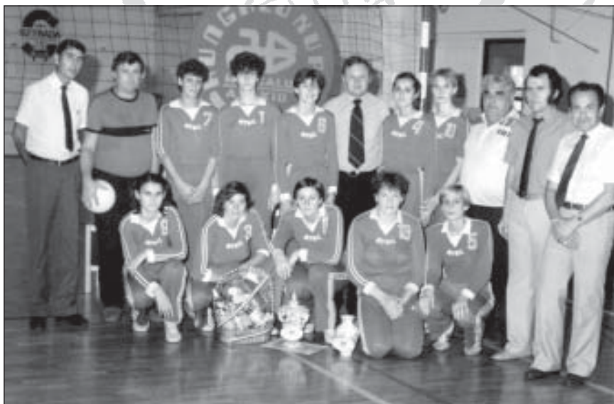
Röplabda csapat 1985