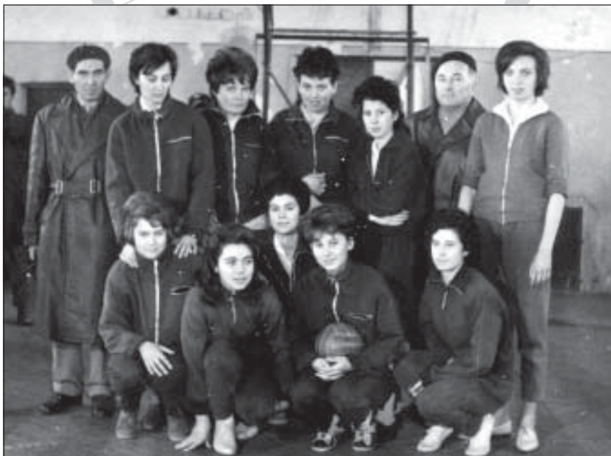
Női röplabda csapat 1963