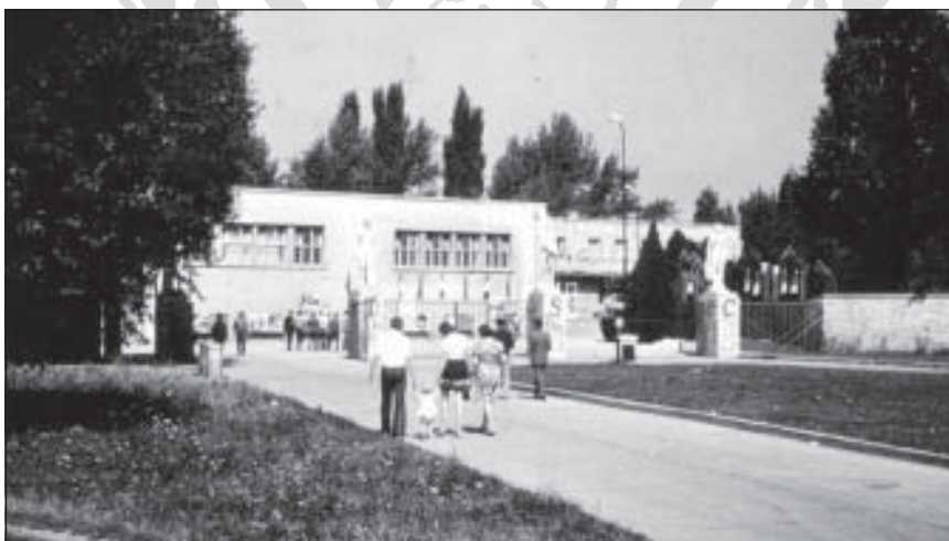
Az ATSC bejárata szobrokkal