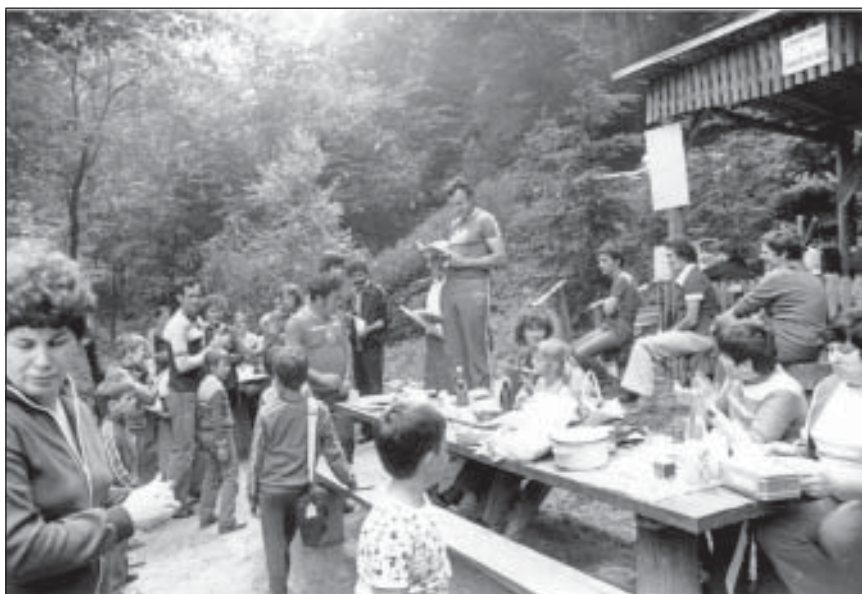
Sportnap a Vértesben található Mátyás-kútnál