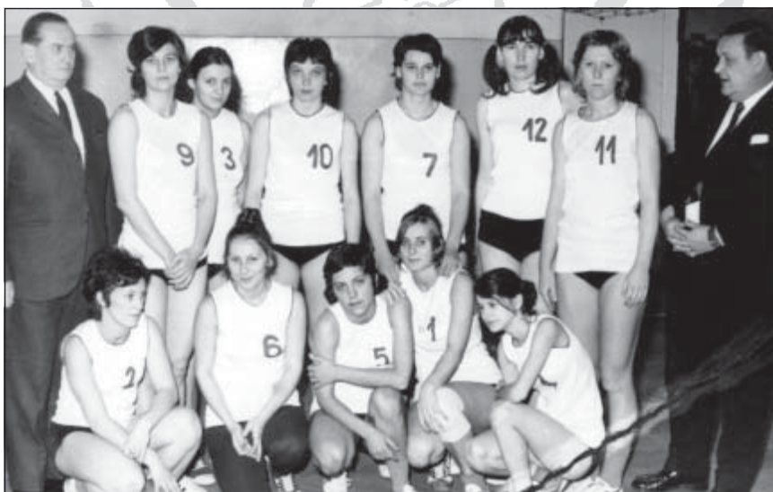
Női röplabda csapat 1973