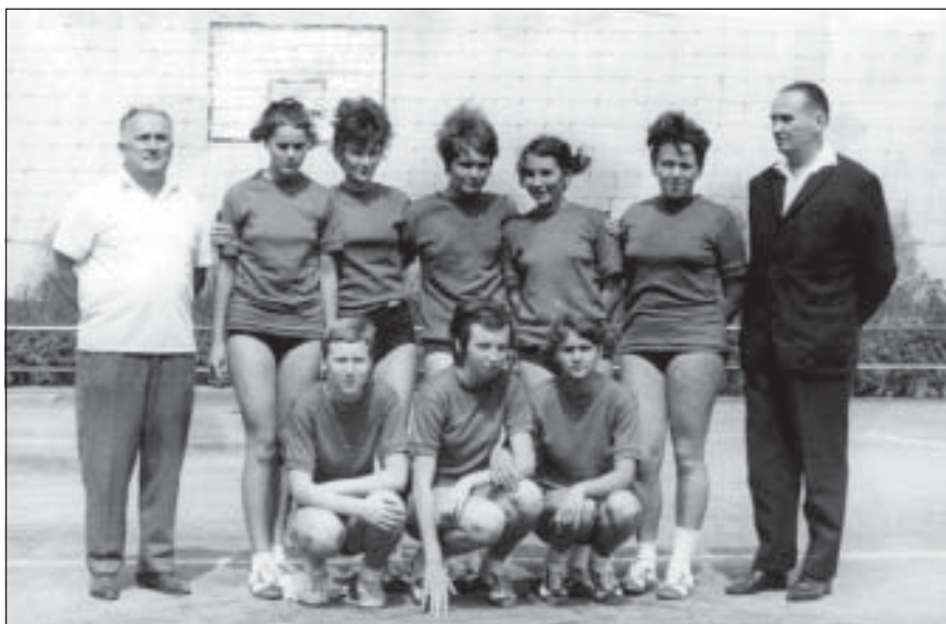
Női NB1-es röplabda csapat 1967