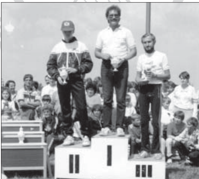
VI. Hungalu-kupa 1986. nyertesei