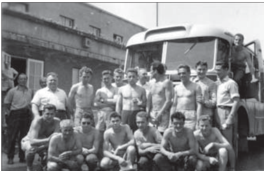
Férfi focicsapat 1960