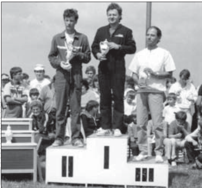
VI. Hungalu-kupa 1986. nyertesei