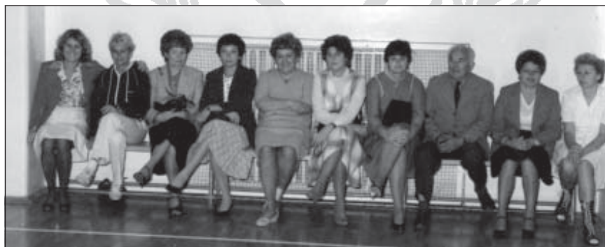
Női röplabda csapat a 20 éves találkozón, 1986.