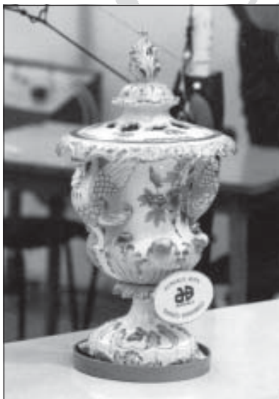
Motorcsónak HUNGALU Kupa örökös vándoríja

A jövő nemzedéknek és a sportvezetésnek hasonló eredményeket és sikereket kívánok a „Hajrá Timföld!” buzdítás mintájára.